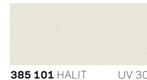
385 101 HALIT UV 30